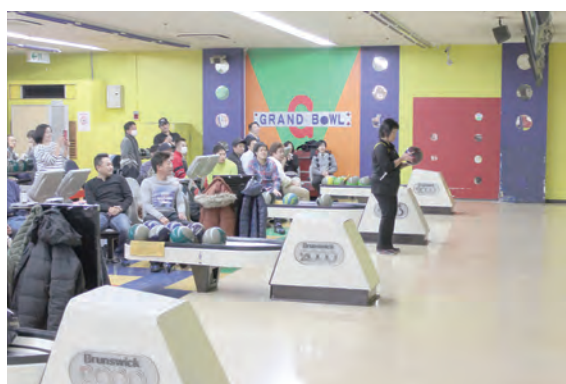
会場：川崎グランドボウル 参加人数：65名