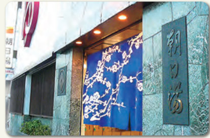
鋼管通りの朝日湯