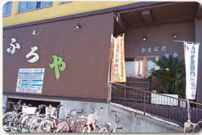
藤崎のかまぶろ温泉