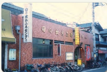
昭和の日の出おふろセンター