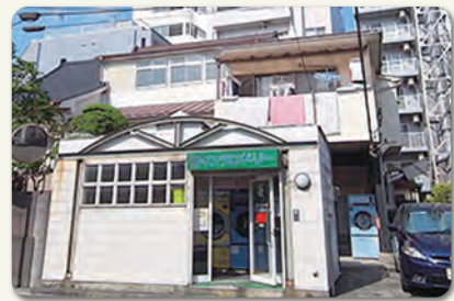
大島上町のバーデンハウス