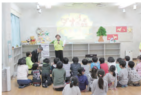
会場：南加瀬小学校