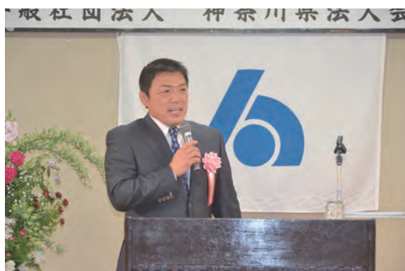
「夢の実現 ～挑戦することの大切さ～」 講師：柔道家 古賀 稔彦氏