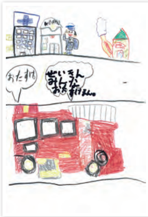
川崎市立東門前小学校 1年生