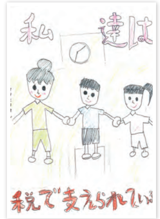
川崎市立大島小学校 5年生