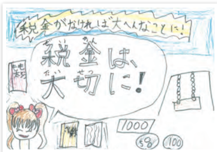
川崎市立幸町小学校 2年生