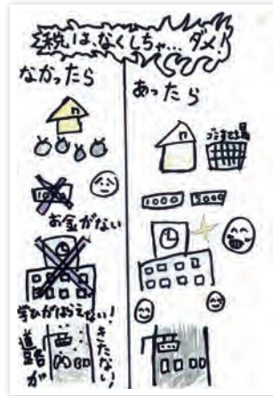
川崎市立戸手小学校 4年生