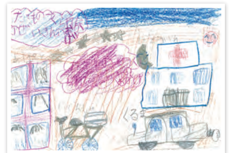
川崎市立東門前小学校 1年生