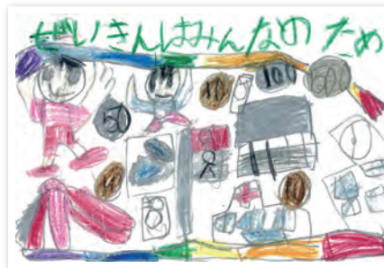
川崎市立東門前小学校 1年生