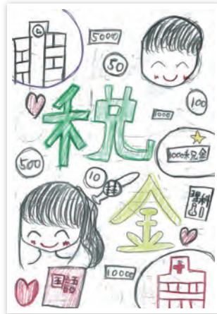
川崎市立旭町小学校 3年生