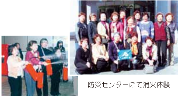
防災センターにて消火体験

日 時：平成22年11月11日(木)～12日(金) 場 所：厚木総合防災センターと七沢温泉 参加者：21名