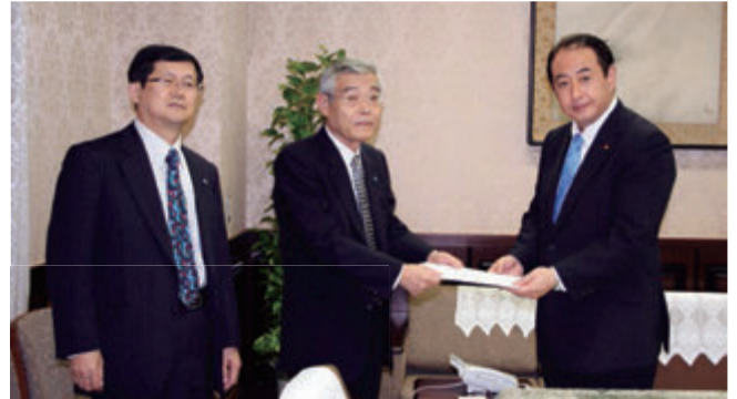
左から 横山専務理事、柳田税制・税務委員長、御法川財務副大臣