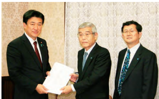
左から 木原財務副大臣、柳田税制委員長、横山専務理事