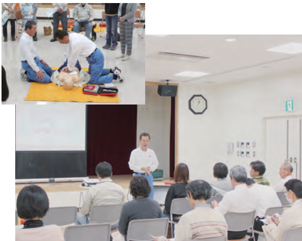
「普通救命講習」 講師：防災指導公社 担当官