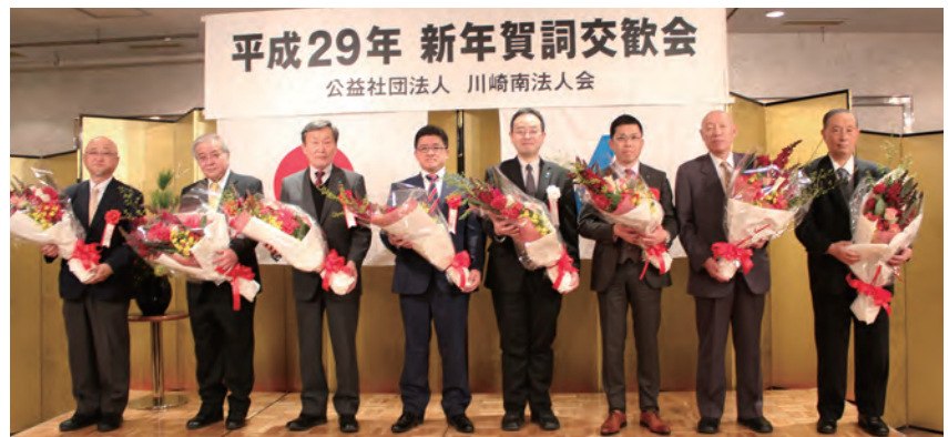
表彰受彰者へ花束贈呈