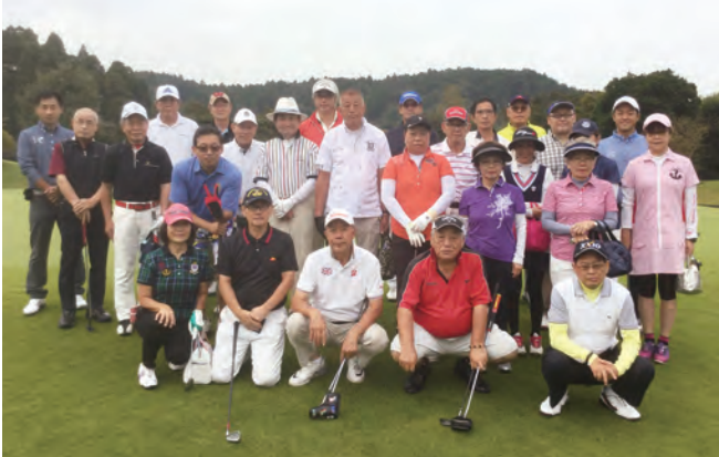
場所：木更津ゴルフクラブ