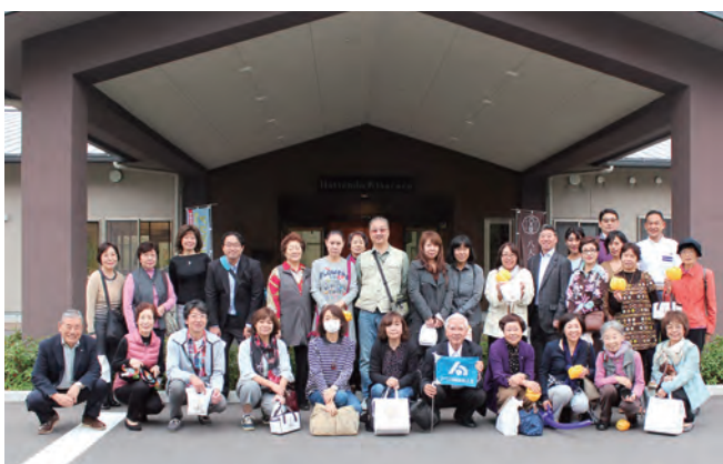
場所：八天堂きさらづ工場 他