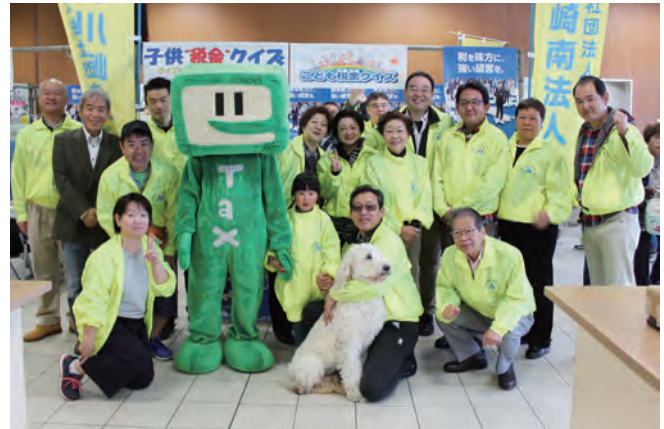
かわさき市民祭り

社会貢献活動の一環として幸区民祭とかわさき市民祭りに参加、出展して税のパンフレット配布、子供税金クイズ、絵はがきコンクールの応募を行いました。