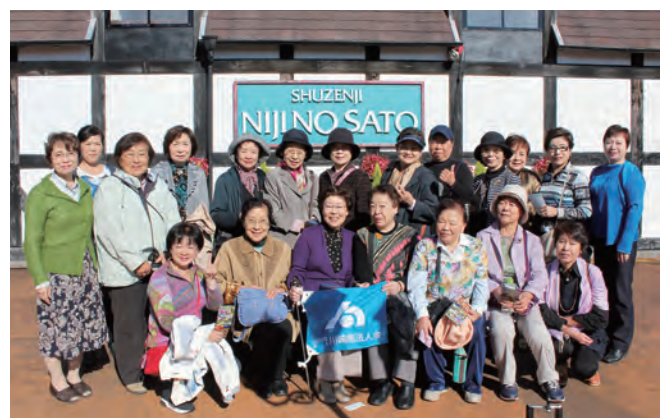
場所：修善寺温泉 他