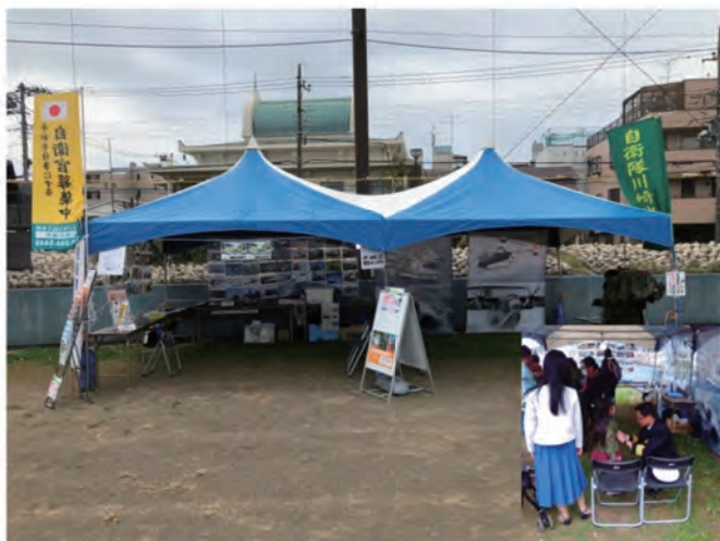
災害派遣、装備品等写真パネルの展示及びちびっ子迷彩服の試着を実施