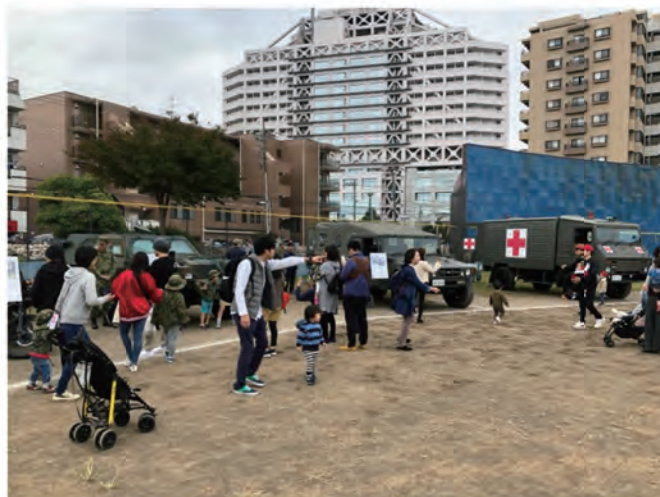
第31普通科連隊の支援を受け、高機動車、軽装甲機動車、オートバイ、救急車を展示